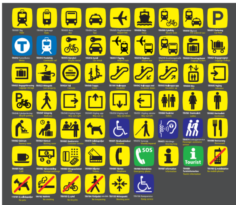
Figur 4: Piktogram med svenska och engelska texter som ska användas vid grafisk utformning av statiska skyltar för trafikinformation på järnvägsstationer

Vid grafisk utformning av statiska skyltar för trafikinformation på järnvägsstationer ska piktogrammen i figur 4 användas.