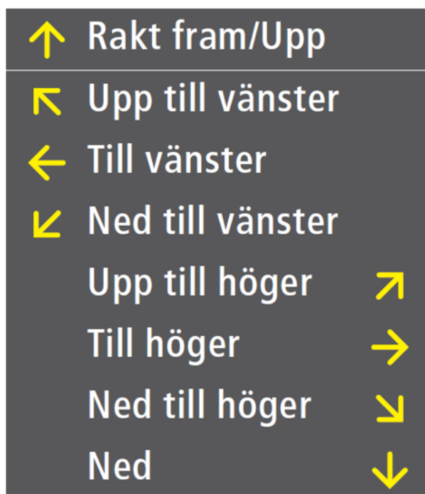
Figur 5 Riktningspilar schematiskt

Vid placering av flera hänvisningsskyltar under varandra i samband med grafisk utformning av statiska skyltar för trafikinformation på järnvägsstationer ska skyltarna rangordnas uppifrån och ned enligt de riktningspilar som återfinns i figur 5 .